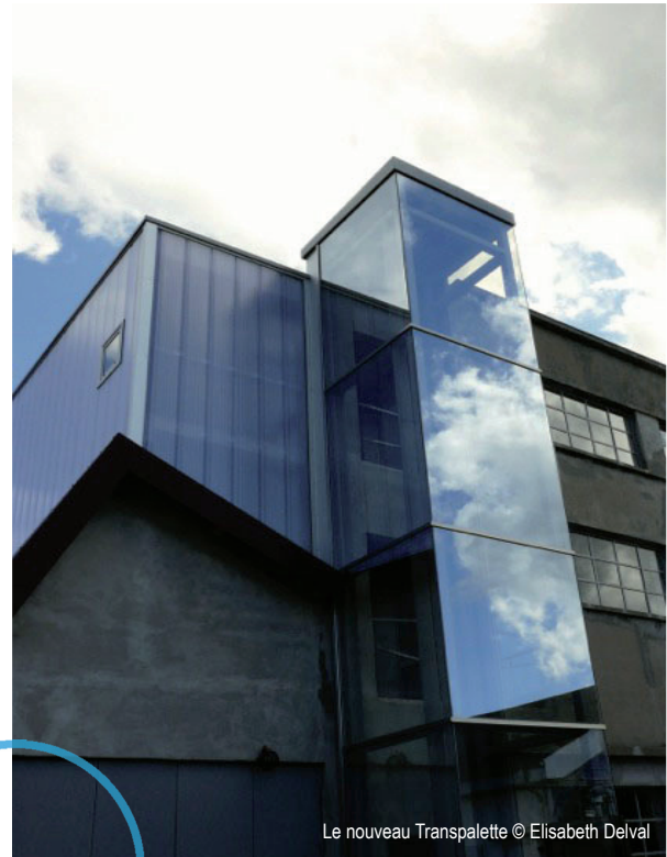
Le nouveau Transpalette

// De cette généalogie émancipatrice est née Entropia , à la fois exposition et événement pluri-séquentiel, zone d'atterrissage interstellaire de frottements, d'interventions plastiques, conférences, performances, concerts... Entropia c'est avant tout un dialogue entre les artistes SMITH, le duo Art Orienté Objet (AOO) et Quimera Rosa. Si SMITH se focalise sur un cas étrange qui avait vu la fusion de deux corps et âmes soviétiques, AOO interroge les frontières de plus en plus ténues entre l'art et le savoir, entre intervention artistique et science. Quant à Quimera Rosa, ils grefferont l'espace de deux semaines leur laboratoire TransPlant au cœur de l'exposition, questionnant les frontières poreuses entre l'humain et le végétal.